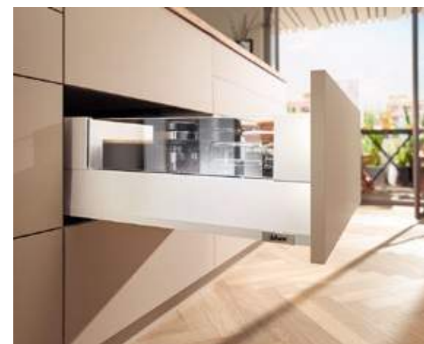
MERIVOBX moduł z BOXCOVER w kolorze jedwabście biały mat