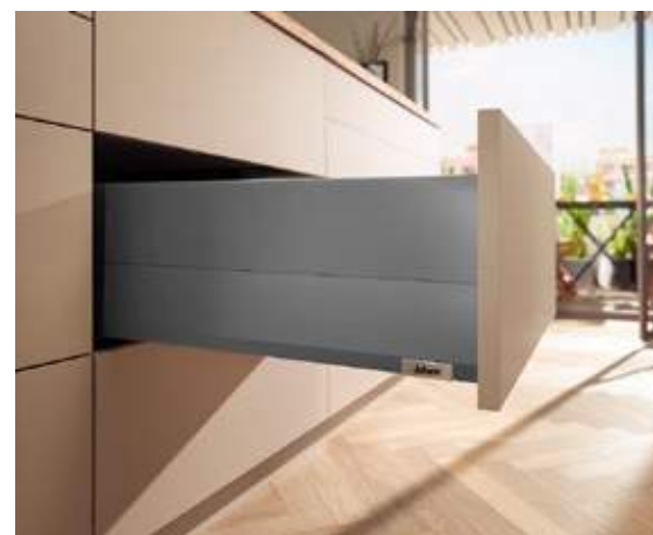
MERIVOBX moduł z BOXCAP w kolorze antracyt mat