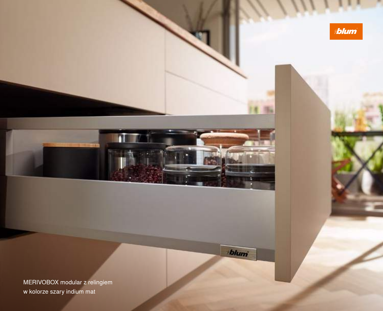
MERIVOBX moduł z relingiem w kolorze szary indium mat